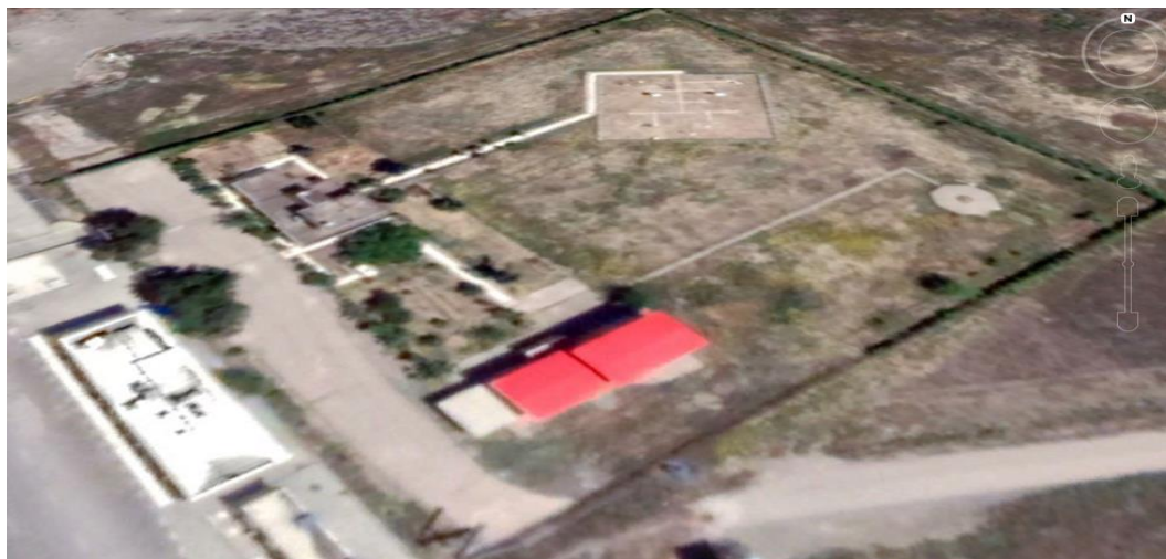
Fig. 1- Aerial image of the geographical location of Mashhad meteorological station